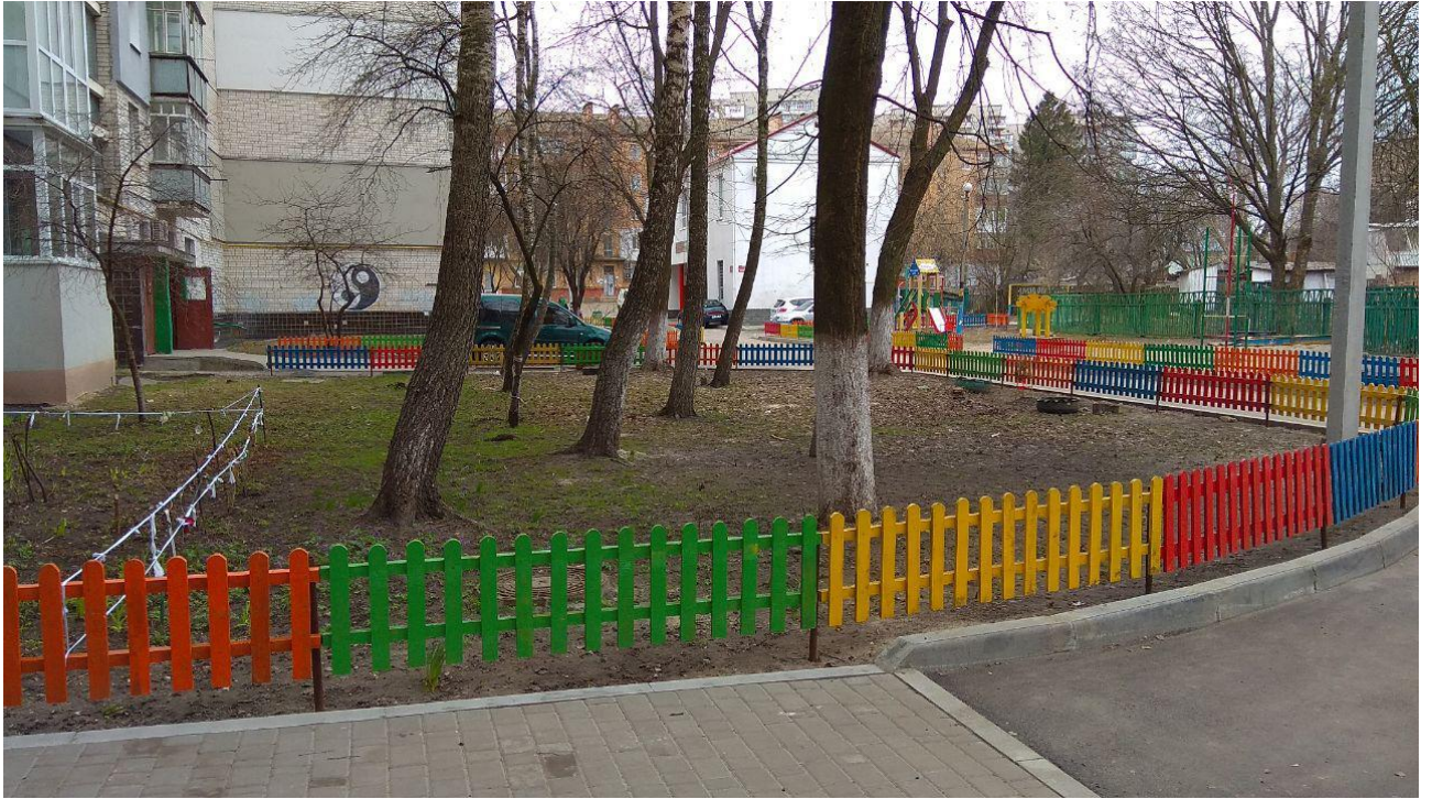
3. Існуючий стан двору