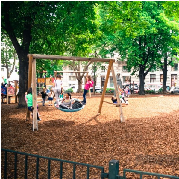
7. Приклад використання покриття із кори резинового покриття