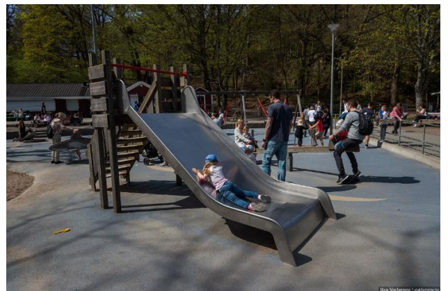
8. Приклад використання