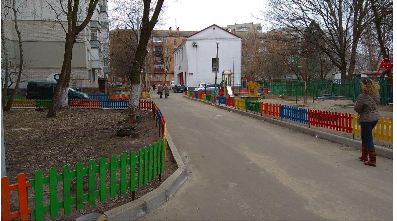
1. Існуючий стан двору