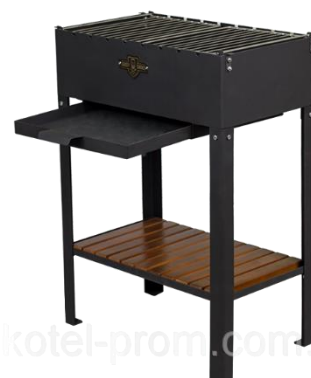
10. Стационарний мангал