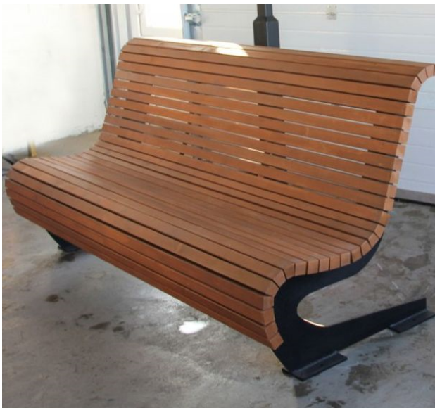
5. Тип лавки для використання у проєкті