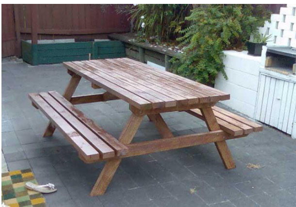
9. Столик з лавками