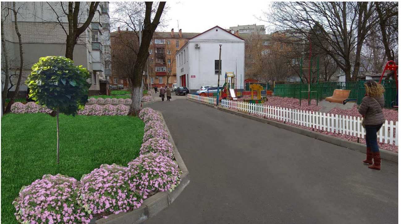
2. Приблизна візуалізація стану двору після реалізації проекту